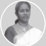
நம்பிக்கைமேரி, தொபஆ, அ.தொ.ப தவளக்குப்பம்

மாணவர்களின் புரிதல் முழுமையடையாததை உணர்ந்து கொண்டு அதற்கு ஏற்றார் போல் வீடியோக்களைப் பயன்படுத்தினேன். வீடியோக்களைப் பார்த்தப் பின்பு மாணவர்கள் மிகவும் ஈடுபாட்டோடு உரையாடலில் கலந்துகொண்டனர்.