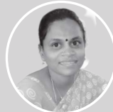
நாகம்மா, தொபஆ, அ.தொ.ப தானம்பாளையம்