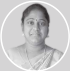
கேஷ்வர்தினி தொபஆ, அ.தொ.ப நெல்லித்தோப்பு