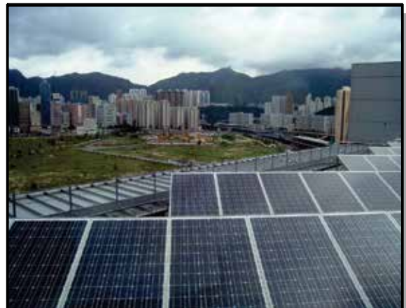
हांगकांग में सौर विद्युत संयंत्र

इनमें से सौर ऊर्जा पृथ्वी पर सबसे अधिक प्रचुरता से उपलब्ध है। वास्तव में, पृथ्वी पर एक घण्टे में सूर्य से जितनी ऊर्जा आती है वह पूरे ग्रह की